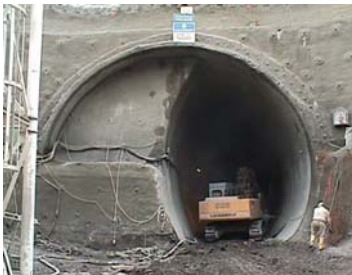
Ulmenstollenvortrieb zur Querung der Westbahn

Bereits in der Planung mussten sowohl die Auswirkungen des fertig gestellten Bauwerkes als auch die während der Bauarbeiten zu erwartenden