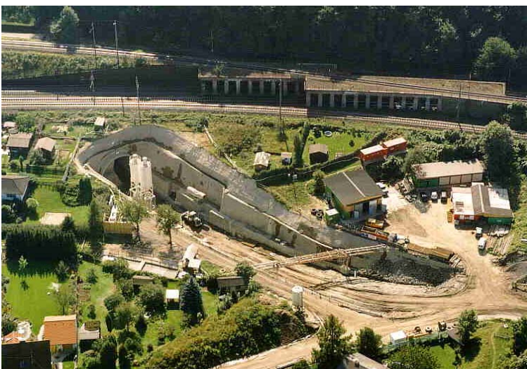
Voreinschnitt West des Mona-Lisa-Tunnels mit Querung der Westbahn

Die den Schlier überlagernden, bis über 20 m mächtigen quartären Sedimente bestehen aus sandigen Terrassenkiesen und Lößlehm. In der Niederflur des Trauntales lagern postglaziale Kiese direkt auf den Sedimenten des Oligozänschliers.