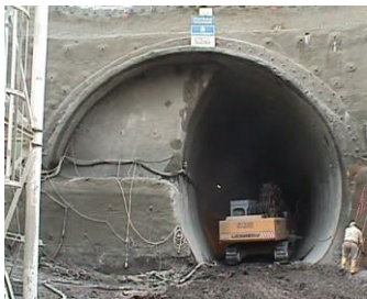
Ulmenstollenvortrieb zur Querung der Westbahn

Bereits in der Planung mussten sowohl die Auswirkungen des fertig gestellten Bauwerkes als auch die während der Bau-